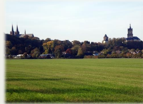
Stadtsilhouette Mit Stiftskirche und Schwanenburg

Der Vorstand des VHD e.V. und die Reichswaldbrauer Kleve freuen sich schon sehr, Euch im Jahr 2020 begrüßen zu dürfen.