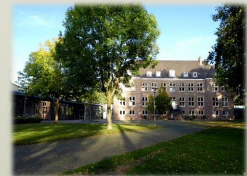
Der Veranstaltungsort Die Wasserburg Rindern